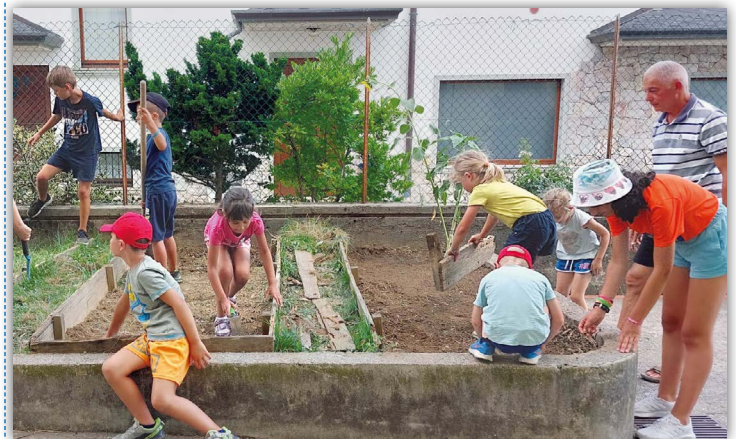
Nella versione on-line clicca sull'immagine