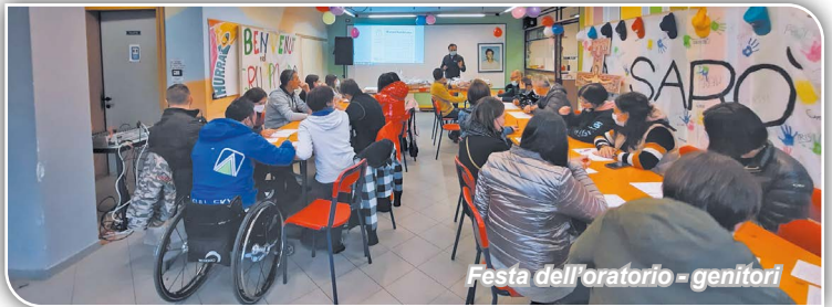
Festa dell'oratorio - genitori