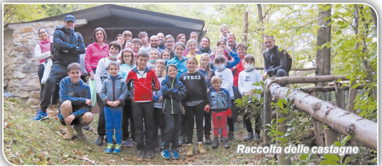
Raccolta delle castagne