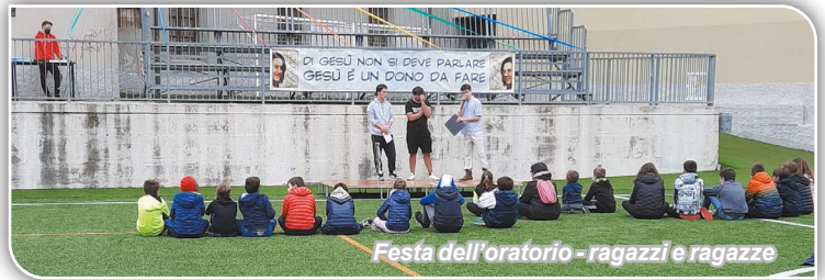
Festa dell'oratorio - ragazzi e ragazze