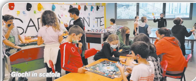
Giochi in scatola