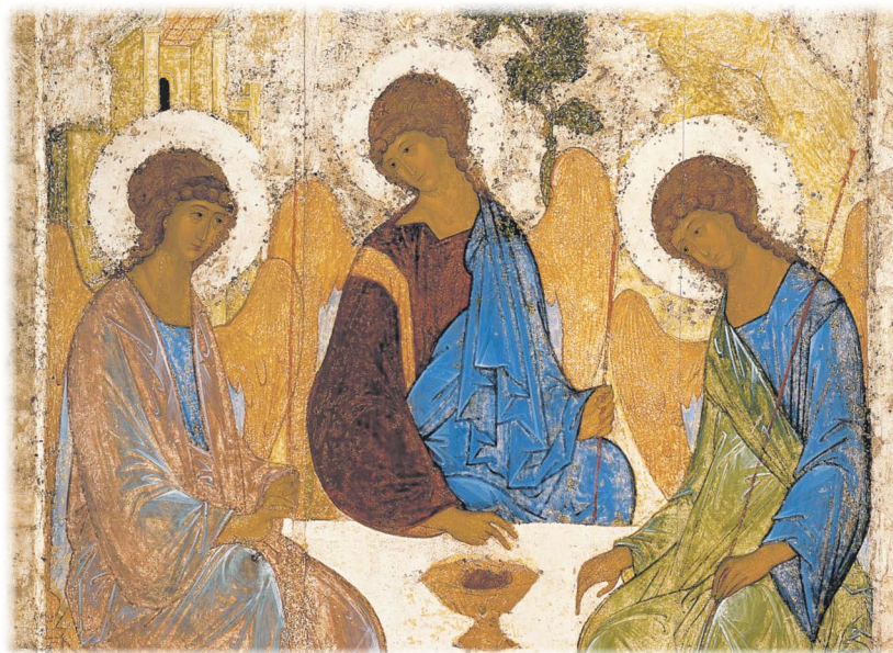
Trinità (Andrej Rublëv): i tre angeli annunciano che Abramo e Sara avranno un figlio.

E il nostro Vescovo, nella sua ultima lettera pastorale indirizzata alla diocesi, concretamente rivolge questo invito: una scelta che la famiglia può compiere, è quella di superare le tentazioni di chiusura e di ripiegamento e ricercare un'appartenenza più vasta, coltivando relazioni con altre famiglie e con i diversi mondi abitati: si tratta di passare dall'appartamento all'appartenenza comunitaria. La comunità cristiana offre alla famiglia i doni della parola di Dio, dell'Eucarestia e dei Sacramenti, capaci di alimentare quel fuoco necessario per essere "casa", insieme alla possibilità di pensare incontri fraterni tra famiglie per nutrire la fede e creare spazi di gioia per stare insieme.