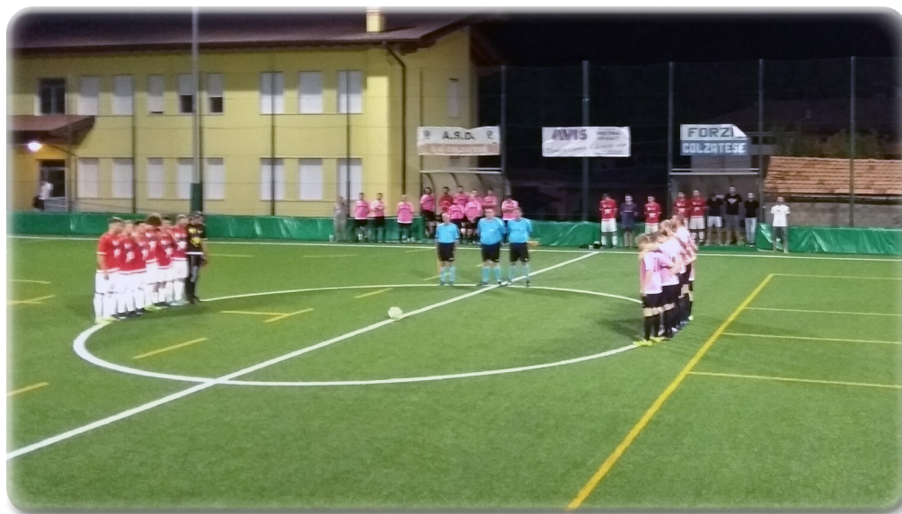
Grandi momenti del torneo estivo Solari Roberto AM 2019