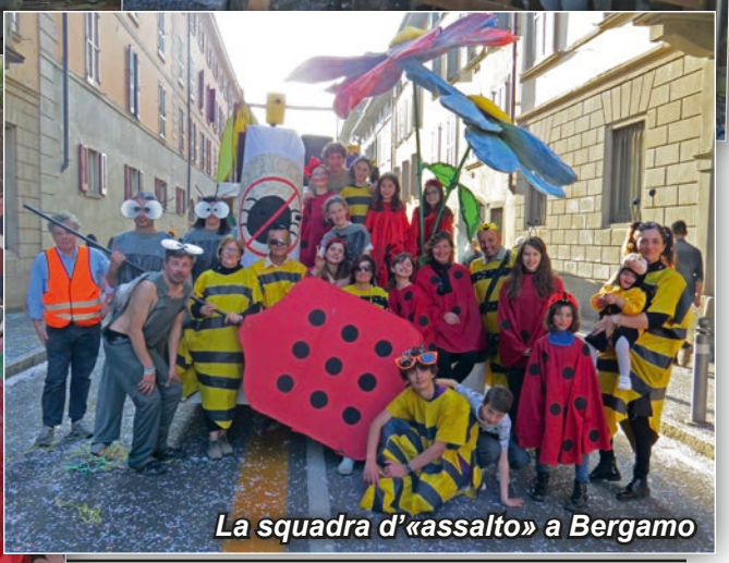
La squadra d'«assalto» a Bergamo