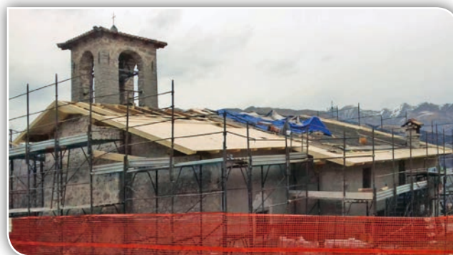
Visione dei restauri in corso alla chiesetta di Barbata.