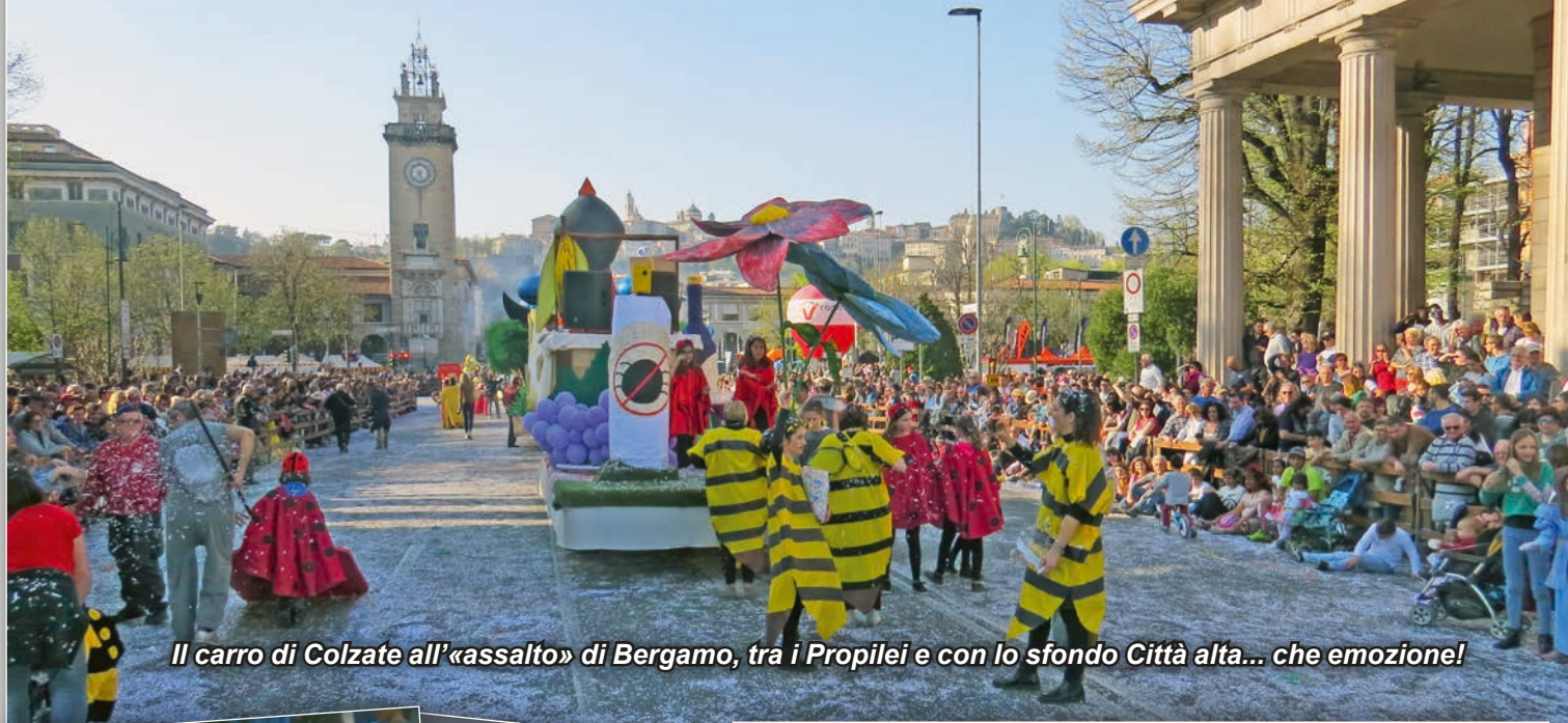
Il carro di Colzate all'«assalto» di Bergamo, tra i Propilei e con lo sfondo Città alta... che emozione!