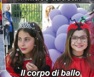
Il corpo di ballo