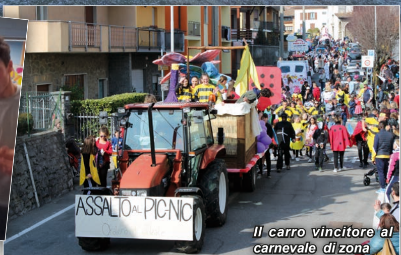
Il carro vincitore al carnevale di zona