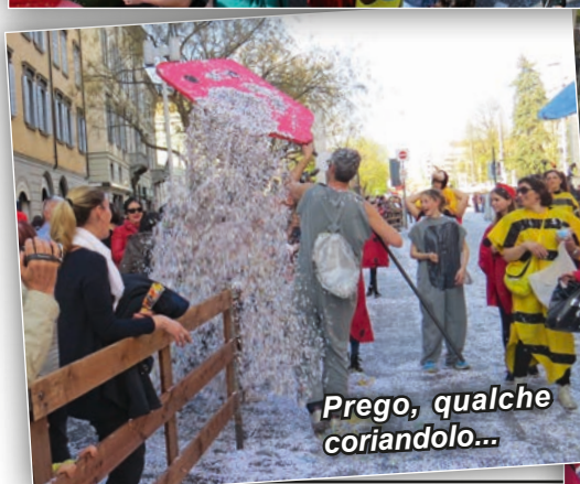
Prego, qualche coriandolo...