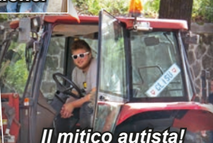
Il mítico autista!