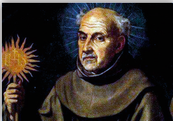
S. Bernardino con lo stemma del nome di Gesù, simbolo che lo contraddistingue