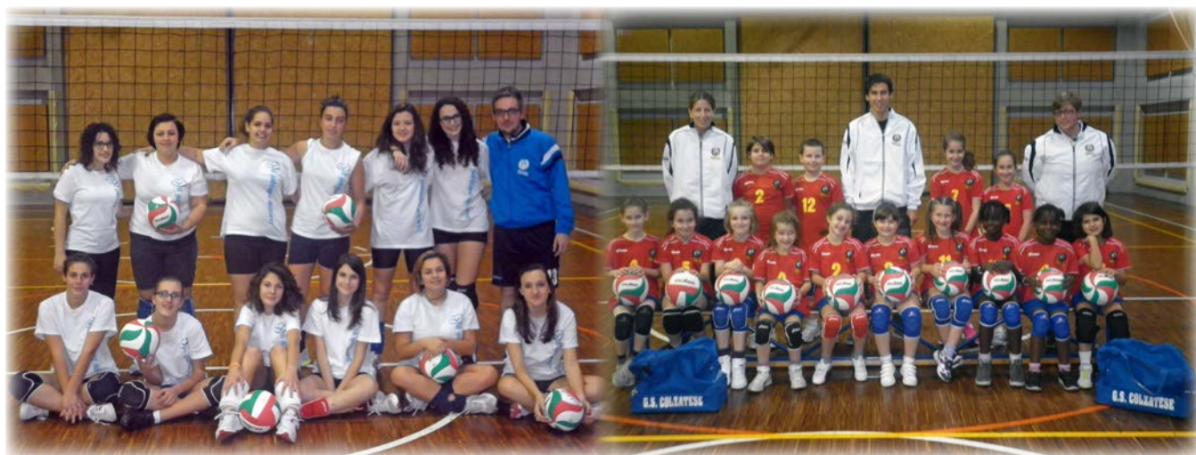
Il gruppo di pallavolo delle "Allieve" (a sinistra) e la scuola di pallavolo per i "Piccoli" (a destra), entrambe con i rispettivi allenatori