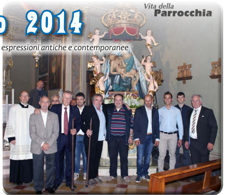
Il gruppo dei portatori che con fatica ma con gioia "accompagnano" la nostra Madonnina per le vie del paese. Grazie!

Nel mese a lei dedicato, quello di maggio, la nostra parrocchia ha riproposto anche quest'anno i consueti due incontri settimanali di preghiera nelle serate di lunedì e mercoledì con la recita del Rosario e la celebrazione della Messa presso alcune abitazioni private e presso alcuni punti del paese, noti questi per essere l'espressione di un'antica devozione popolare. Il primo incontro di preghiera si è tenuto così presso la Cappellina della "Pisóna", eretta nell'omonima località vicino all'ex mulino e all'antico lavatoio e che conserva sopra l'altare la copia di un'artistica tela raffigurante il gruppo della Pietà, opera di Giambattista Paganessi. Il secondo si è tenuto presso la cappella dei "Mórcce di Salècc", costruita "in memoria dei defunti della peste del 1630 (190 su 375 abitanti)