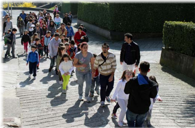
Alcune "istantanee" dalla Festa di S. Patrizio