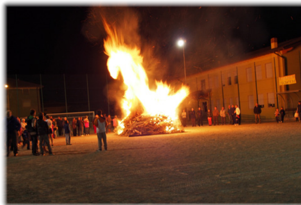
Alcuni momenti del "falò" organizzato al termine della S. Messa vespertina, momento allietato dal nostro Corpo Bandistico.