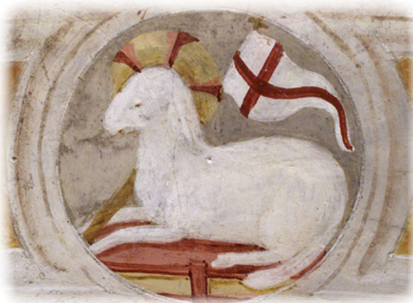
L'«Agnello Pasquale» da un affresco del Santuario di S. Patrizio