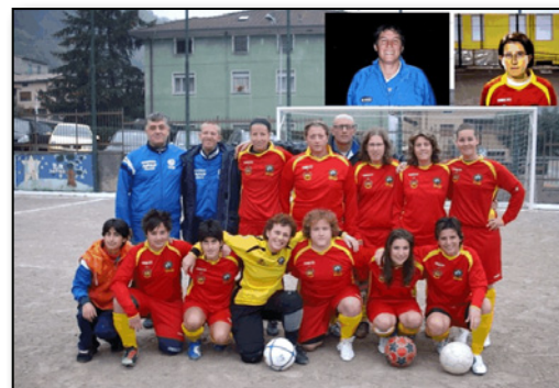
La squadra femminile