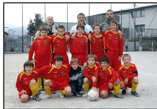
La squadra degli esordienti