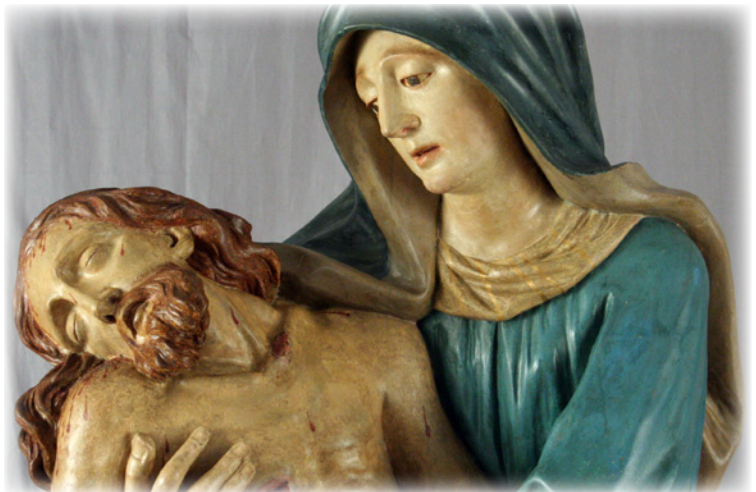
Da due angolazioni leggermente diverse, si può notare la differenza di una parte della statua da prima (a sinistra, dopo aver già completato però l'opera di pulitura) a dopo il restauro (a destra).