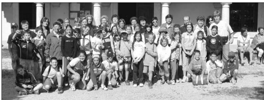
I catechisti, i ragazzi ed i loro genitori in visita al Santuario della Madonna d'Erbia

La catechesi di Iniziazione Cristiana che ha come tappe significative le celebrazioni dei sacramenti della Riconciliazione (8 anni) della Prima Comunione (9 anni) e della Cresima (13 anni) ha coinvolto 89 ragazzi dai sei fino ai tredici anni e 10 catechisti che settimanalmente si sono ritrovati con i ragazzi loro affidati per un cammino formativo attorno ad un progetto di conoscenza e pratica della vita cristiana. È impossibile dare una valutazione dei risultati ottenuti (se si prende come metro di misurazione la partecipazione all'Eucaristia domenicale, certamente non c'è molto da esultare) ma l'impegno dei catechisti per offrire una proposta ben strutturata e coinvolgente non è certamente mancato. L'eventuale rinnovamento che il Sinodo diocesano