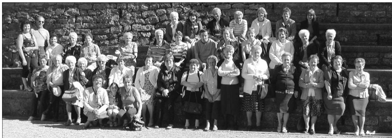
Il Gruppo Solidale Parrocchiale in pellegrinaggio al Santuario della Madonna del Perello

vizio che risponde ad un bisogno, è una casa che si costruisce con la collaborazione di tutti. E più le persone si mettono in gioco più è possibile realizzare cose belle. L'invito a farsi avanti e a partecipare alla costruzione di questa realtà comunitaria è rivolto a tutti. Anche la "stanza dei compiti" è giunta a termine. Si è trattato di un servizio offerto ai bambini per lo svolgimento dei compiti scolastici due pomeriggi alla settimana. Grazie ad un finanziamento regionale si è potuto dare il via a questa iniziativa che continuerà anche per il prossimo anno scolastico con il sostegno dell'amministrazione comunale. Sicuramente ci sono aggiustamenti da fare soprattutto per l'organizzazione e la gestione dei tempi, ma il lavoro svolto è stato prezioso, sia per il discreto numero di partecipanti (25/30 ragazzi), sia per i miglioramenti che qualcuno ha ottenuto.