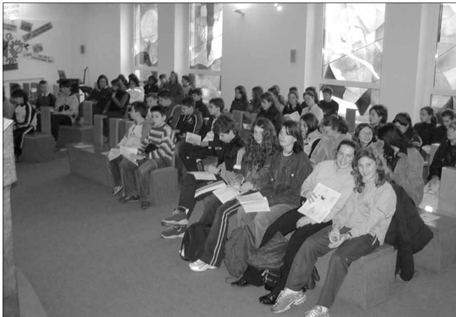
I cresimandi del vicariato nella chiesa delle medie del Seminario.

“GIORNATA VICARIALE PER I CRESIMANDI IN CITTÀ ALTA” – La vacanza pasquale ha permesso di raccogliere circa 100 adesioni di ragazzi delle parrocchie del nostro vicariato che quest'anno celebrano la Cresima. Partenza alle 8 per Città Alta dove, dopo una proposta di riflessione differenziata per ragazzi (in Seminario) e ragazze (Noviziato delle Poverelle), abbiamo visitato il Seminario Diocesano e celebrato l'Eucaristia. Gli ampi spazi di gioco messi a disposizione ci hanno anche permesso di giocare e divertirci nel tempo libero. La visita alla Cattedrale, guidata dal vulcanico don Aldo, nostro vicario e, per molti, un bel gelato, hanno “dolcemente” concluso questa riuscita giornata. Vedi foto seguente.