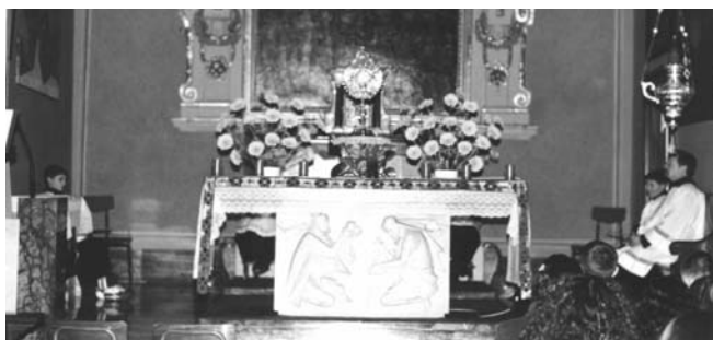
La preghiera eucaristica, un momento molto forte nel cammino di revisione degli adulti.

Ora sto cercando di migliorarmi e di recuperare.