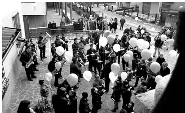
Le note festose della banda preludono il lancio di palloncini con i messaggi augurali